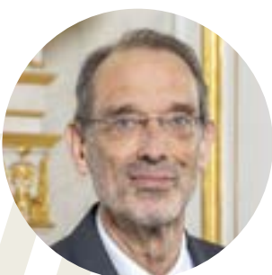
Bundesminister Univ.-Prof. Dr. Heinz Faßmann

Mit dem 8-Punkte-Plan für die Digitale Schule setzen wir die größte Investition um, die es im digitalen Bildungsbereich jemals gegeben hat.